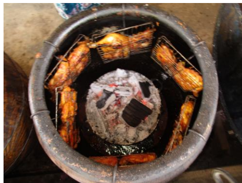
Proses penyediaan ayam pasu