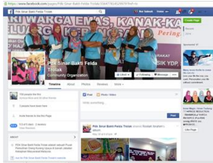
Laman Facebook PDK Sinar Bakti

iv) Lain-lain (contoh : proses penghasilan produk, penglibatan dalam aktiviti lain, dsb)