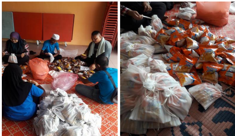
Proses pembungkusan Oishi Frita

iv) Lain-lain (contoh : proses penghasilan produk, penglibatan dalam aktiviti lain, dsb)